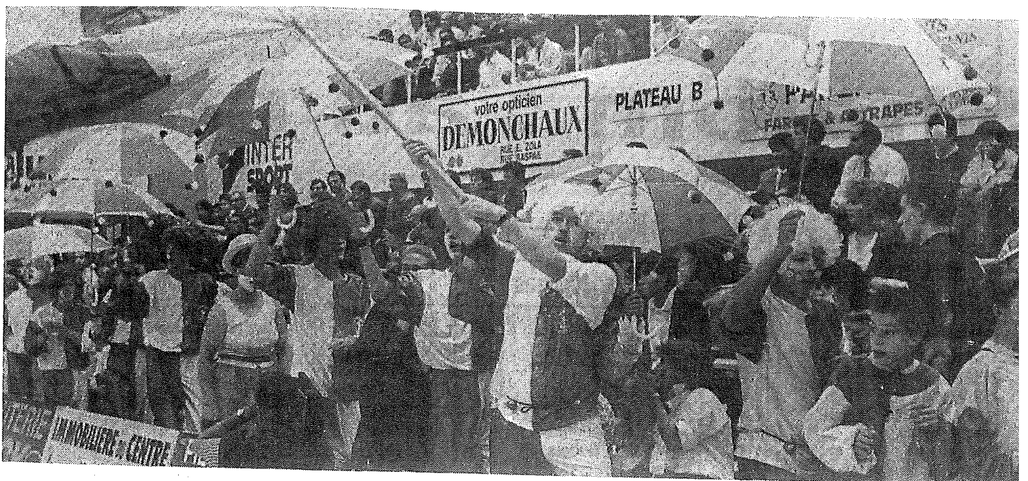
Merveilleux public, véritable 12 e homme une fois encore.