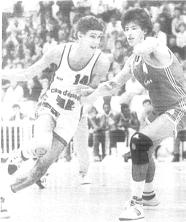
Wymbs, le grand bonhomme de la soirée : la rage de vaincre récompensée.